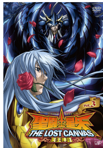
▲ Vol.3 DVD ジャケット