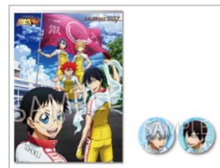
△カレンダー缶バッジセット