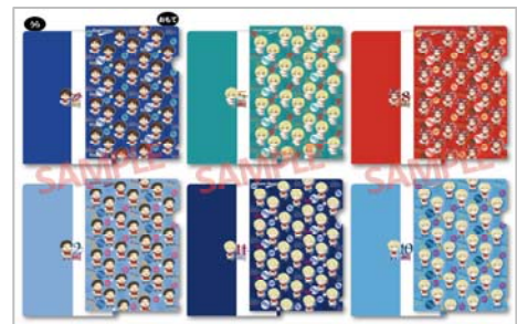
△クリアファイルセット