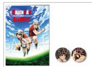
△カレンダー缶バッジセット