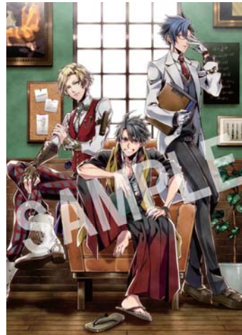
△キャンバスアート

(吉田松陰、ニコラ・テスラ、ヨハネス・フェルメール、ニコロ・パガニーニ、メアリー・シェリー)