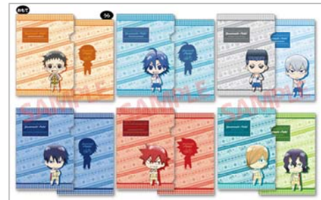
△クリアファイルセット