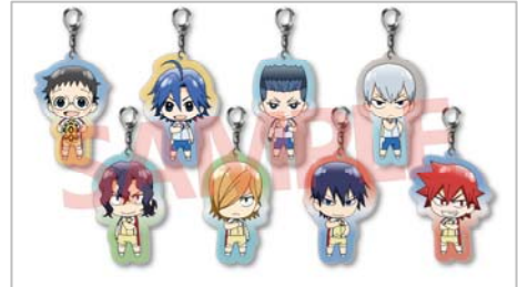
△アクリルキーホルダー