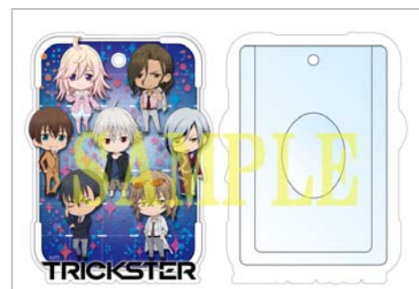
△ダイカットパスケース