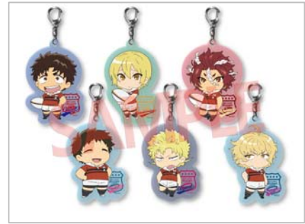
△アクリルキーホルダー