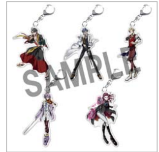
△アクリルキーホルダー