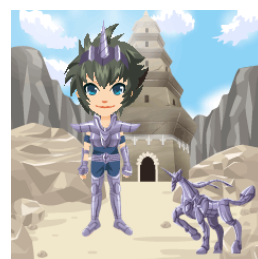
▲アバター例 上:アロン、下:耶人