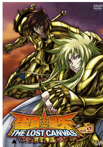
▲Vol.2 DVD ジャケット