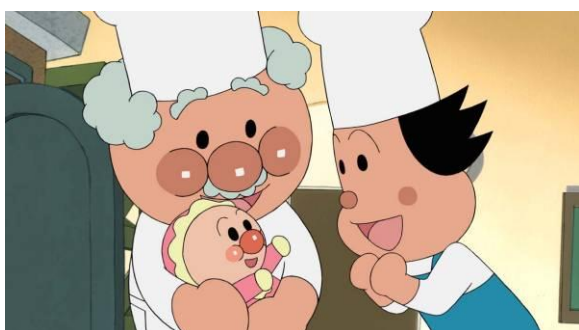
「アンパンマンが生まれた日」