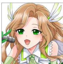
神楽柚希 (CV.優木かな)

アイドル戦隊『EARTH・RAY(あーすれい)』の炎系担当。ある日ラジオで聞いたアイドルの曲に感動して、アイドルを目指しはじめた。やる気は充分だが、空回りすることも。アイドルオーラがないことに悩んでいる。