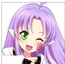
杏菜・リンドバーグ (CV.守屋亨香)

アイドル戦隊『EARTH・RAY(あーすれい)』の風系担当。アイドルをするのが自分の運命と考えている。幼いころから様々な分野で英才教育を受けて育った箱入りのお嬢様。人畜無害そうに見えるが、口を開くと毒舌家。