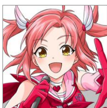
葛城天音 (CV.三村ゆうな)

アイドル戦隊『EARTH・RAY(あーすれい)』の炎系担当。ある日ラジオで聞いたアイドルの曲に感動して、アイドルを目指しはじめた。やる気は充分だが、空回りすることも。アイドルオーラがないことに悩んでいる。