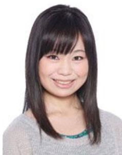
三村ゆうな (葛城天音 役)