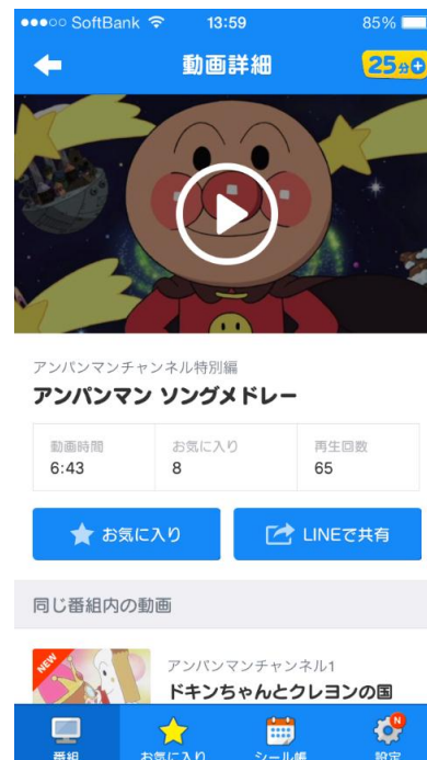
(C) アンパンマンデジタル LLP