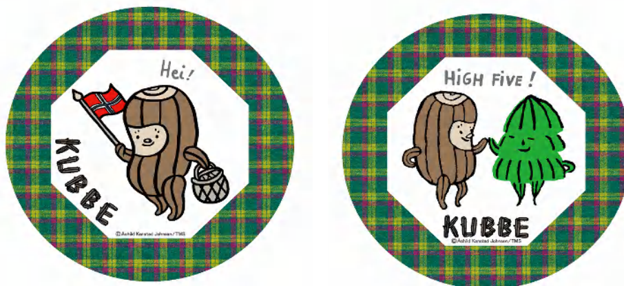
【伊勢丹新宿店限定商品】 缶ミラー(2種類) 各 600 円(税別)